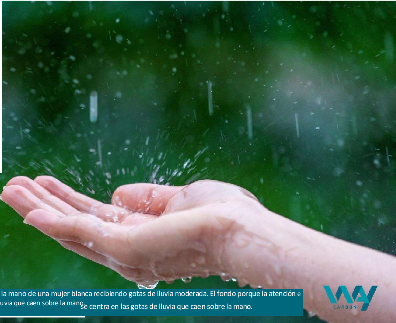
Imagen: fotografía de la mano de una mujer blanca recibiendo gotas de lluvia moderada. El fondo por que la atención e centra en las gotas de lluvia que caen sobre la mano. Se centra en las gotas de lluvia que caen sobre la mano.

WayCarbon se compromete a proteger a las personas contra posibles represalias. Cada denuncia será investigada y resuelta adecuadamente.