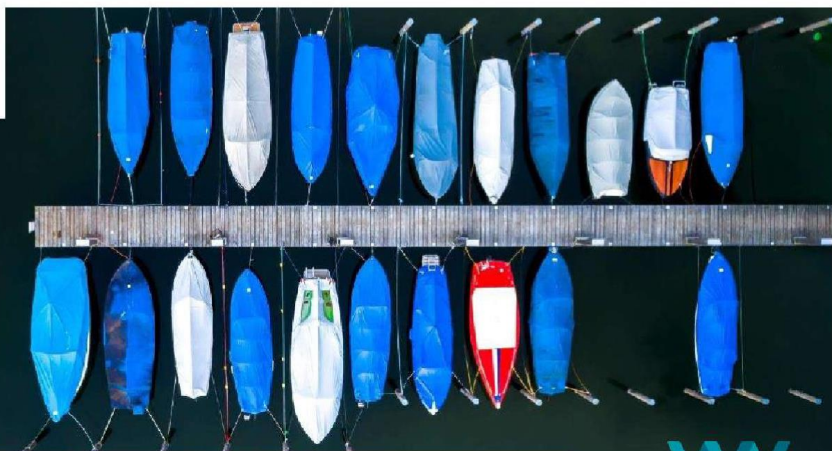
Imagen: fotografía de um sobrevôo de um porto onde vários barcos cobertos com lonas azuis estão (texto escondido) sobre um lago de águas com uma coloração verde escuro.