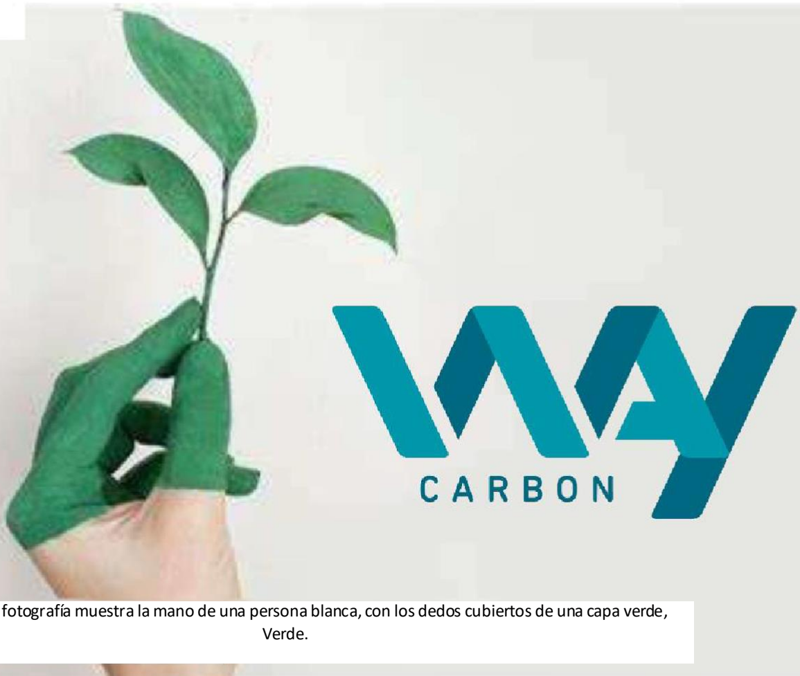
Imagen: La fotografía muestra la mano de una persona blanca, con los dedos cubiertos de una capa verde, Verde.

Por eso, nuestra marca y reputación son muy valoradas y preservadas por nosotros, ya que representan el trabajo de los profesionales de WayCarbon que están orgullosos de su trayectoria y de los resultados obtenidos hasta el momento.