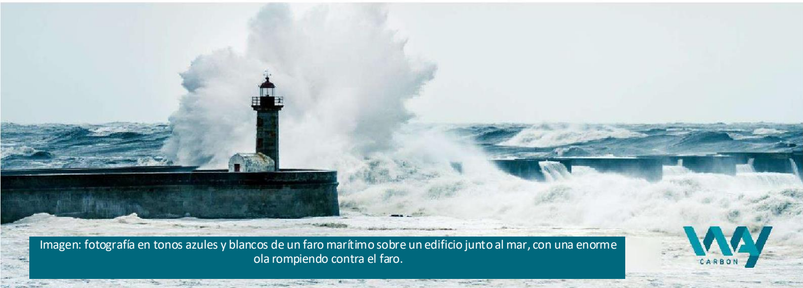
Imagen: fotografía en tonos azules y blancos de un faro marítimo sobre un edificio junto al mar, con una enorme ola rompiendo contra el faro.