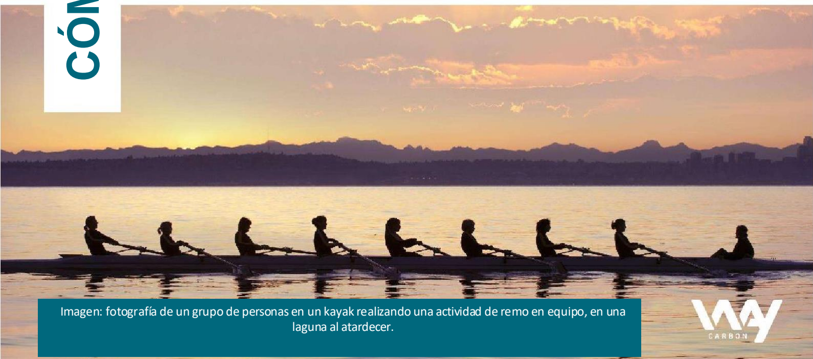
Imagen: fotografía de un grupo de personas en un kayak realizando una actividad de remo en equipo, en una laguna al atardecer.