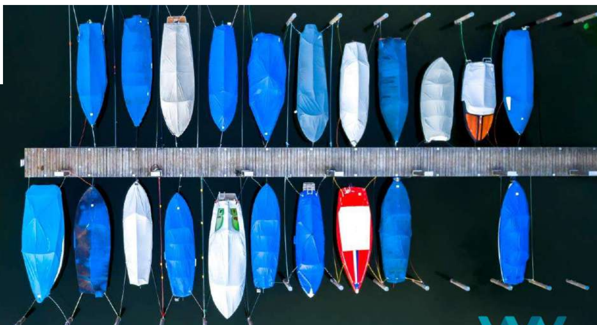
Imagem: fotografia de um sobrelô de um porto onde vários barcos cobertos com lonas azuis estão sobre um lago de águas com uma coloração verde escuro.