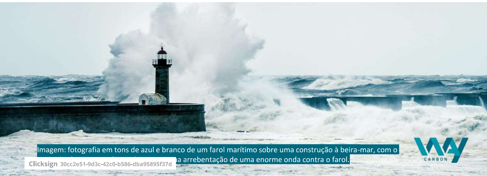
Imagem: fotografia em tons de azul e branco de um farol marítimo sobre uma construção à beira-mar, com o

Clicksign 30cc2e51-9d3c-42c0-b586-dba95895f37d