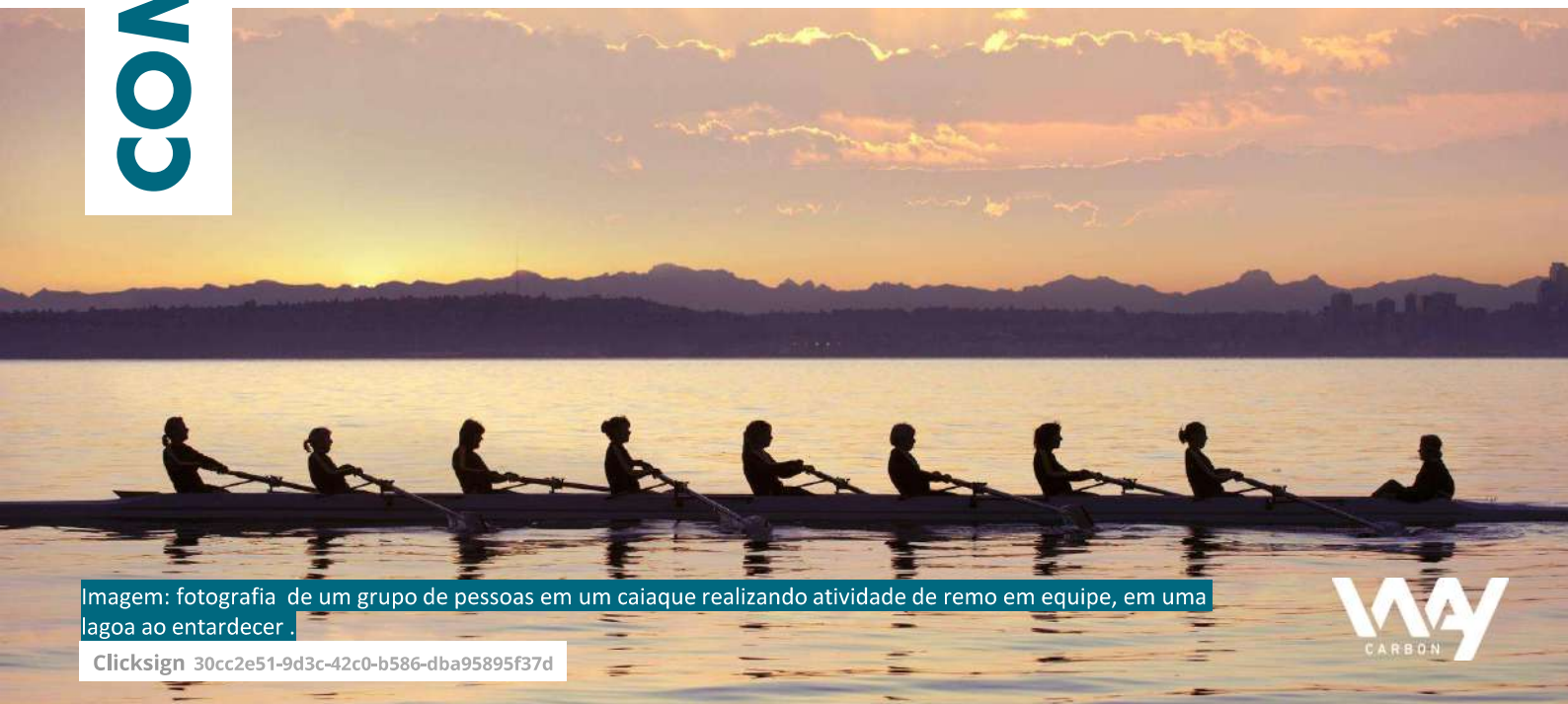
Imagem: fotografia de um grupo de pessoas em um caiaque realizando atividade de remo em equipe, em uma lagoa ao entardecer.

Clicksign 30cc2e51-9d3c-42c0-b586-dba95895f37d